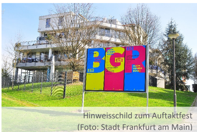
Hinweisschild zum Auftaktfest