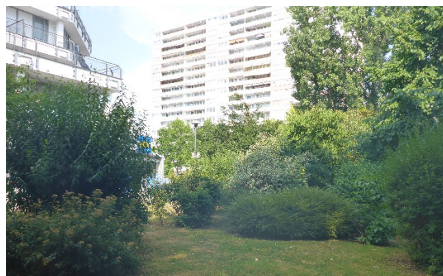
Grünfläche am Quartierseingang Ladenzeile

Im Rahmen des Förderprogrammes Sozialer Zusammenhalt sollen die dort bestehenden Grünflächen nun neugestaltet und bepflanzt werden. Für das angrenzende Café soll eine Platzfläche entstehen sowie ein Bücherschrank für die BewohnerInnen aufgestellt werden. Zudem soll eine Einfassung mit Sitzgelegenheiten für die weg begleitenden Beete das Erscheinungsbild des Quartierseingangs verbessern.