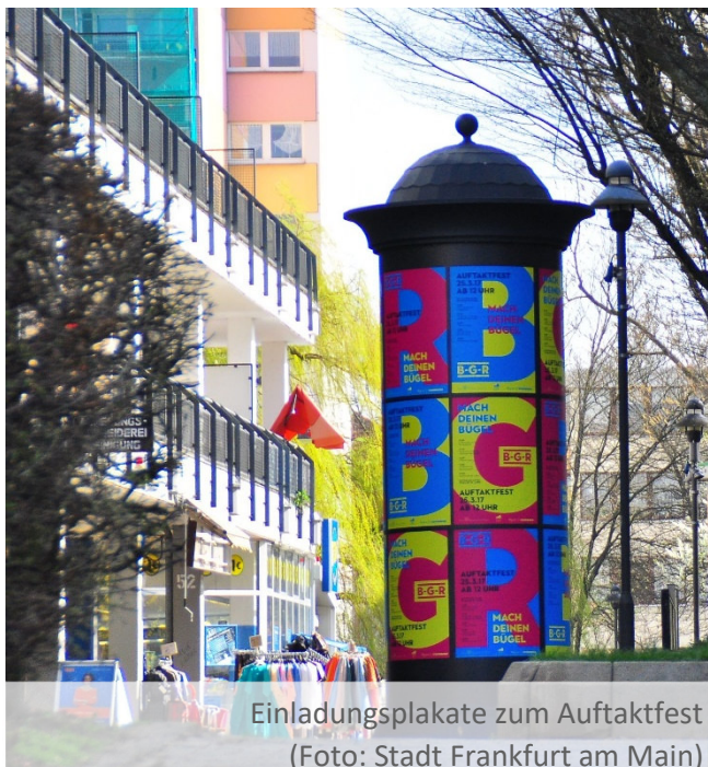
Einladungsplakate zum Auftaktfest