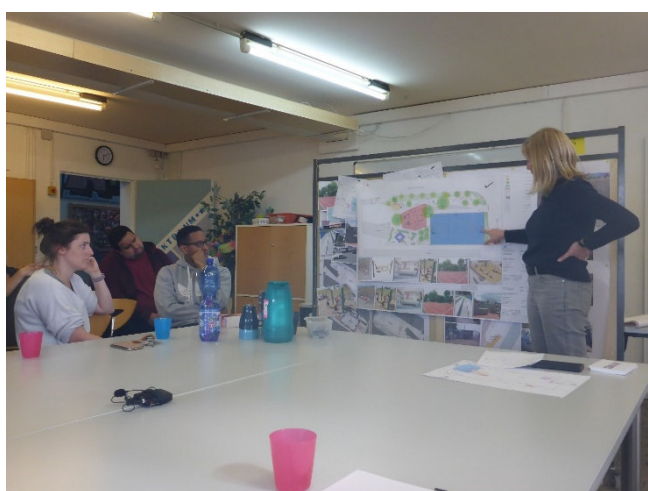
Beteiligung Jugendliche im Jugendhaus

baufällige Tribüne erneuert und der Mädchentreff erhält ein eigenes Bodentrampolin, Hängematten und Hochbeete für Urban Gardening. Vormittags können die neuen Freiflächen auch von kleineren Kindern aus den umgebenden Einrichtungen genutzt werden. Da die Jugendlichen schon sehr lange auf eine Neugestaltung ihrer Freiflächen warten, soll die bauliche Umsetzung nun im Frühjahr 2021 begonnen werden. Die Maßnahme wird zu 100% aus Mitteln des Bund-Länder-Programms gefördert.